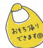
おみやげ豆腐 121円 (税込130円)