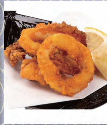
いか唐揚げ 319円 147kcal/塩分1.2g (税込350円)