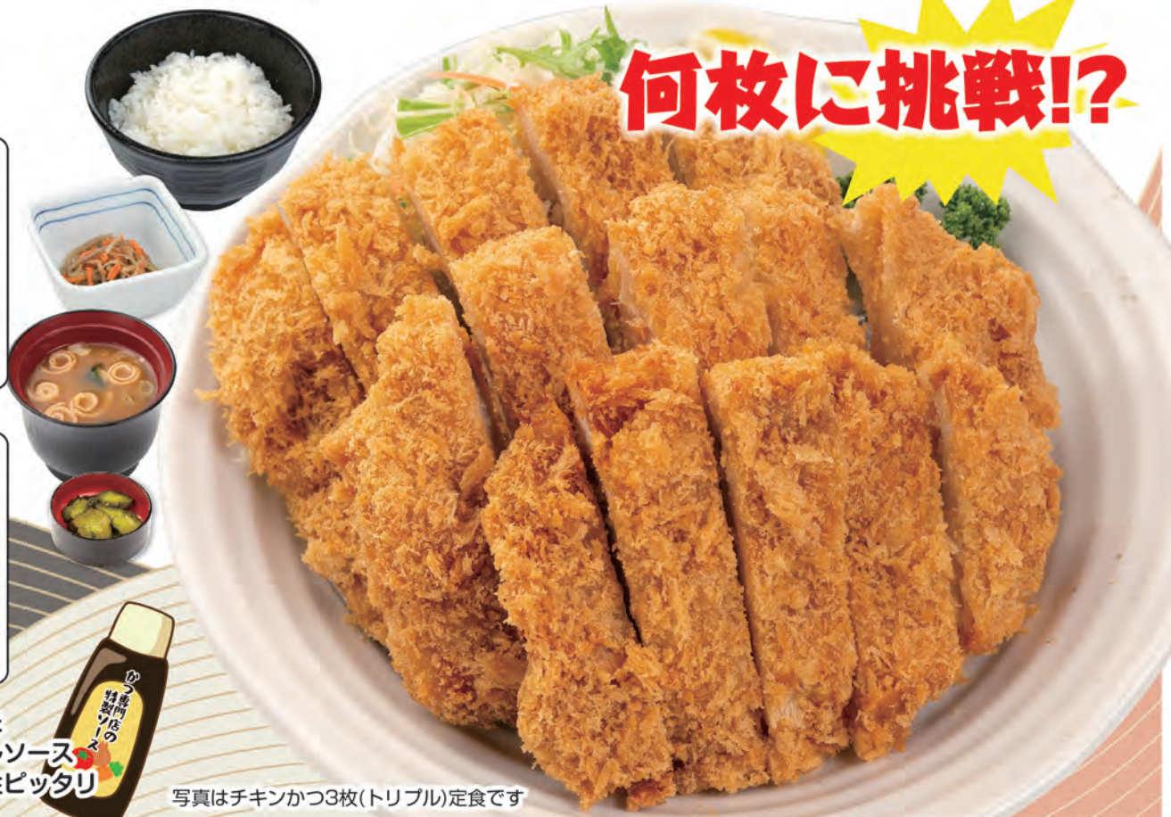
写真はチキンかつ3枚(トリプル)定食です

野菜の自然な甘みを活かした かつ専門店の特製オリジナルソース カツに、野菜に、ご飯にも相性ピッタリ