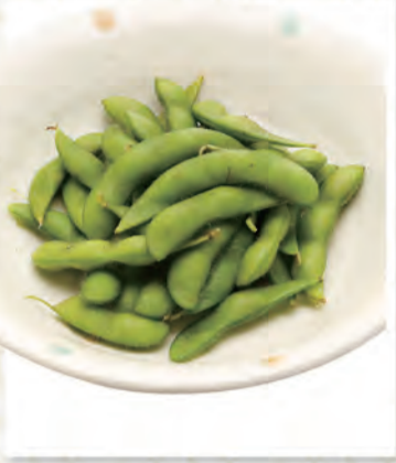
枝豆 273円 74kcal/塩分0.6g (税込300円)