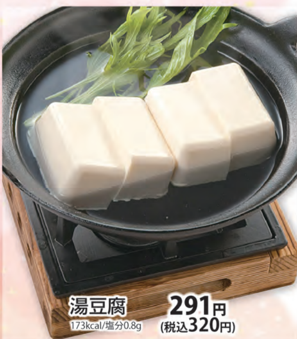
湯豆腐 291円 173kcal/塩分0.8g (税込320円)