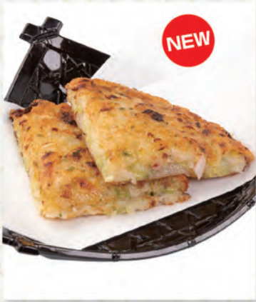
山芋とろり焼き 273円 150kcal/塩分0.8g (税込300円)