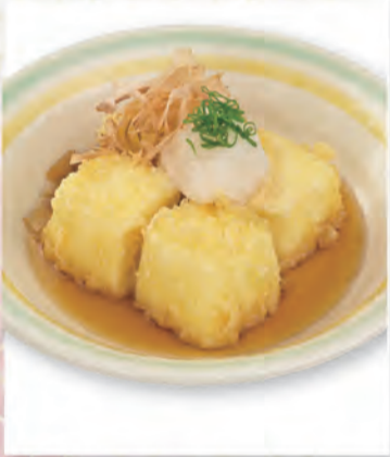
揚げ出し豆腐 410円 393kcal/塩分2.0g (税込450円)