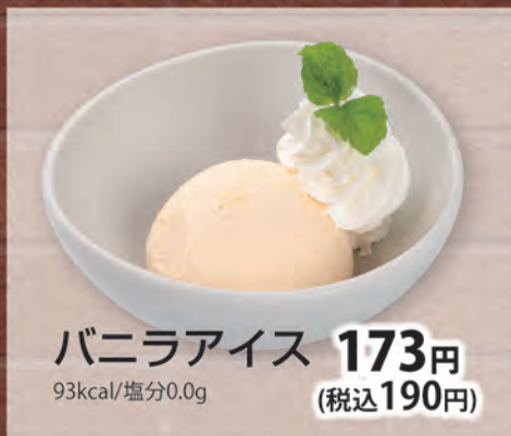
バニラアイス 173円 (税込190円) 93kcal/塩分0.0g