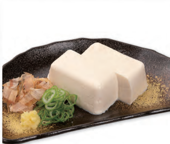
冷奴 191円 89kcal/塩分0.4g (税込210円)