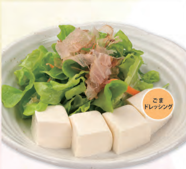
豆腐サラダ 446円 215kcal/塩分1.4g (税込490円)