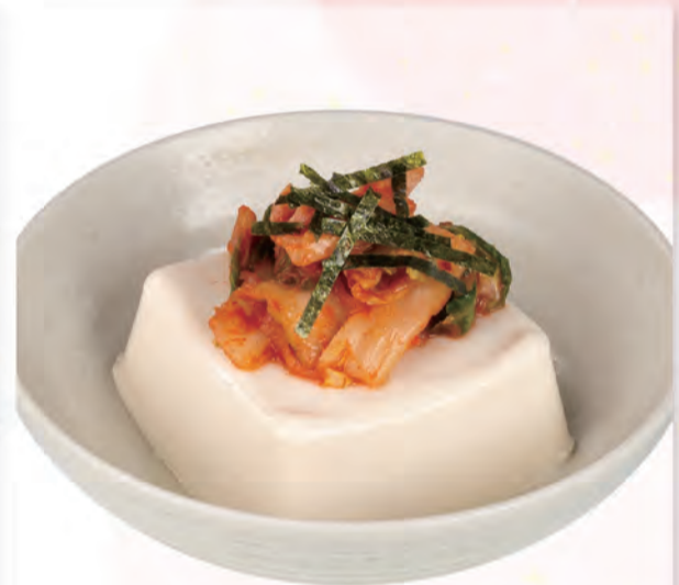
キムチ豆腐 228円 93kcal/塩分1.0g (税込250円)