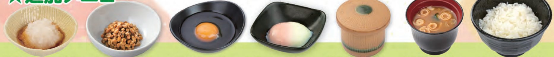
おろしポン酢 110円 (税込120円) 33kcal/塩分1.7g 納豆 64円 (税込70円) 89kcal/塩分0.7g 生卵 64円 (税込70円) 99kcal/塩分0.3g 温泉玉子 73円 (税込80円) 85kcal/塩分0.2g 茶碗蒸し 128円 (税込140円) 57kcal/塩分0.9g みそ汁 64円 (税込70円) 49kcal/塩分1.5g 白飯 128円 (税込140円) 312kcal/塩分0.0g