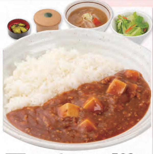
単品 マーボーライス 579kcal/塩分3.7g 582円 (税込640円)