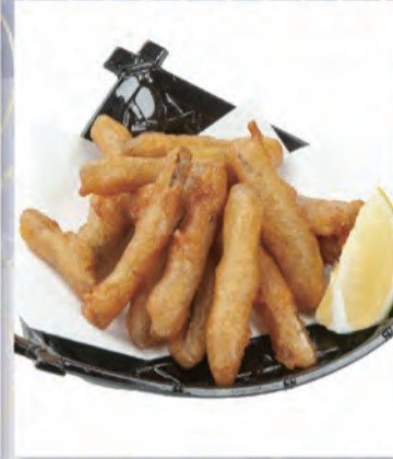
ごぼう唐揚げ 364円 206kcal/塩分0.8g (税込400円)