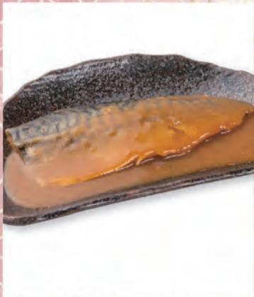
さば味噌煮 591円 355kcal/塩分1.4g (税込650円)