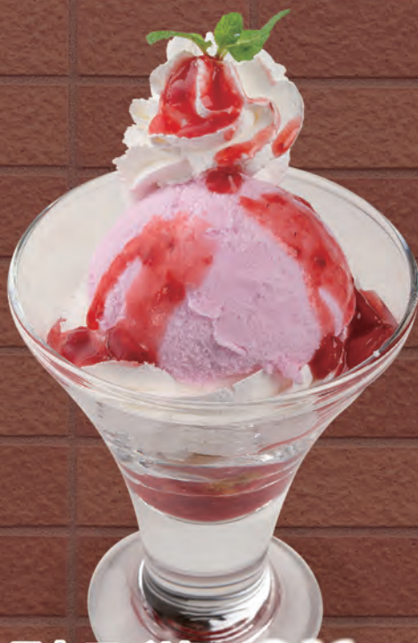
ストロベリーサンデー 346円 (税込380円) 218kcal/塩分0.2g