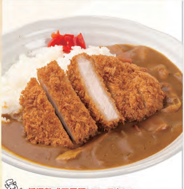
低温熟成三元豚・ロースかつ かつカレー 1,092kcal/塩分4.8g 928円 (税込1,020円)