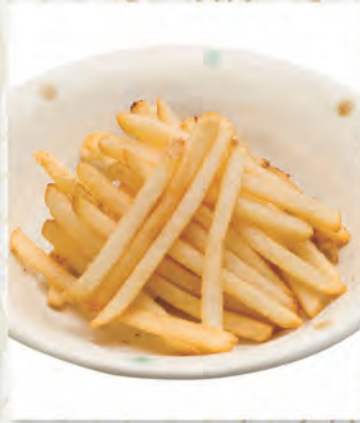
ポテトフライ 228円 284kcal/塩分1.4g (税込250円)