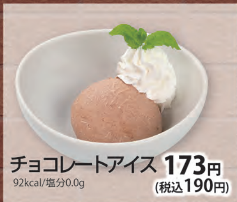
チョコレートアイス 173円 (税込190円) 92kcal/塩分0.0g