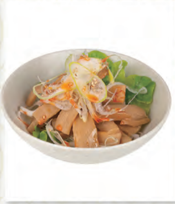
おつまみメンマ 228円 31kcal/塩分1.1g (税込250円)