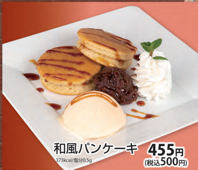
和風パンケーキ 455円 (税込500円) 373kcal/塩分0.5g