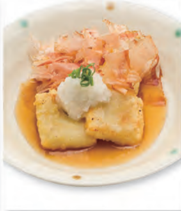
揚げもち 364円 328kcal/塩分1.6g (税込400円)