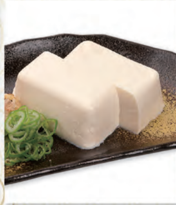
冷奴 191円 89kcal/塩分0.4g (税込210円)