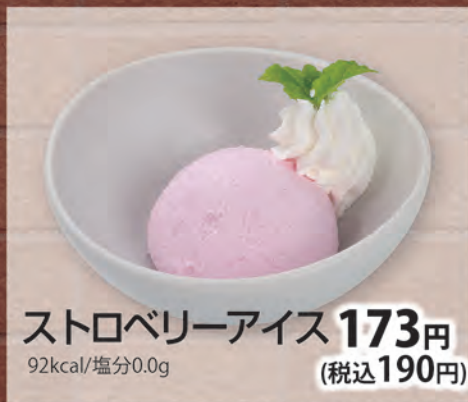
ストロベリーアイス 173円 (税込190円) 92kcal/塩分0.0g