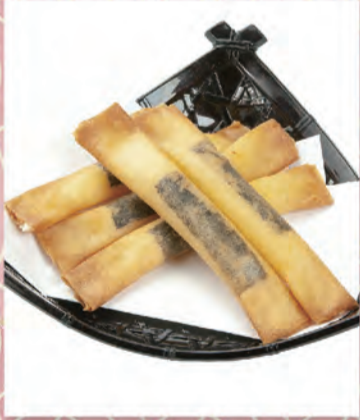
海苔チーズスティック 364円 185kcal/塩分0.7g (税込400円)