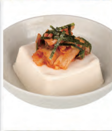
キムチ豆腐 228円 93kcal/塩分1.0g (税込250円)