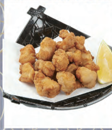
軟骨唐揚げ 364円 142kcal/塩分1.6g (税込400円)