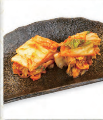
キムチ漬け 273円 27kcal/塩分1.9g (税込300円)