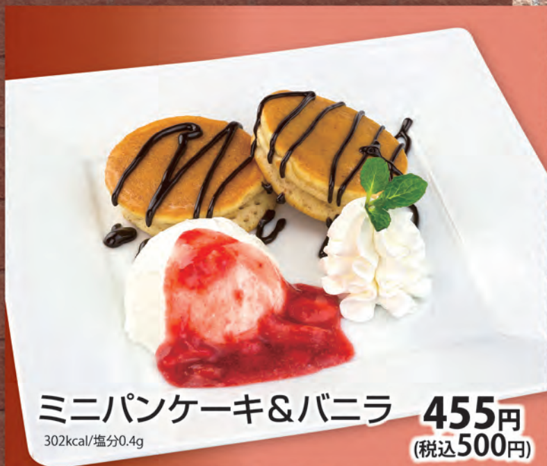
ミニパンケーキ&バニラ 455円 (税込500円) 302kcal/塩分0.4g