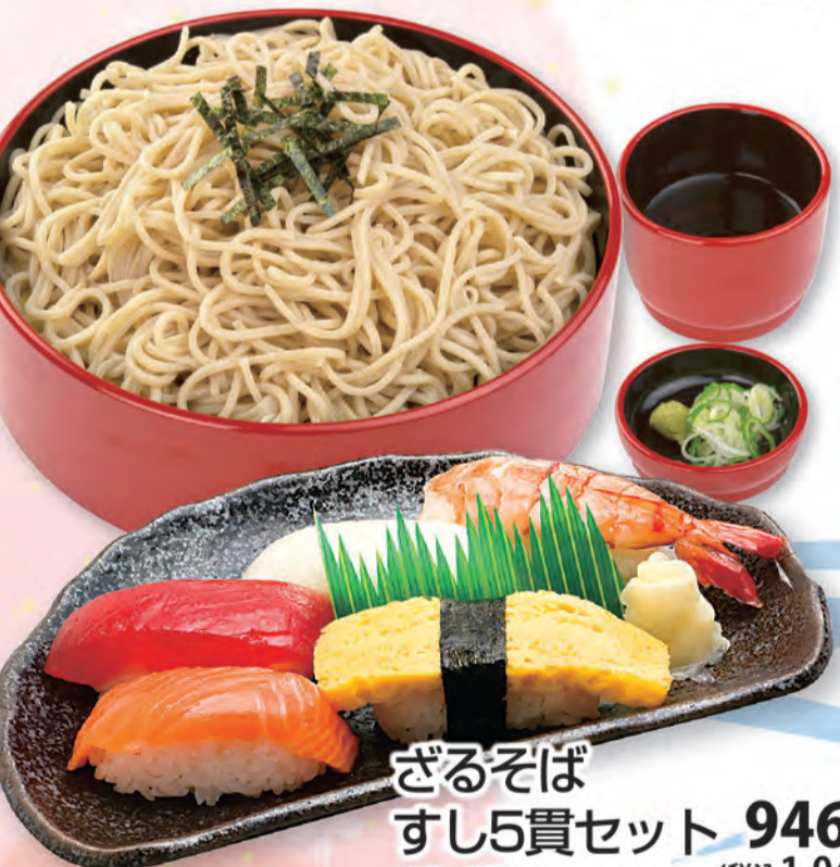
ざるそば すし5貫セット 946円 (税込1,040円) 570kcal/塩分1.9g ●ざるそばのつゆ(1人前) 90cc/塩分2.6g ●醤油5cc/塩分0.8g