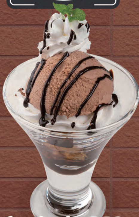
チョコレートサンデー 346円 (税込380円) 210kcal/塩分0.2g