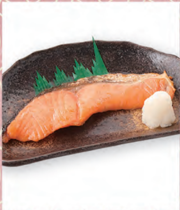
焼き鮭 591円 149kcal/塩分1.6g (税込650円)