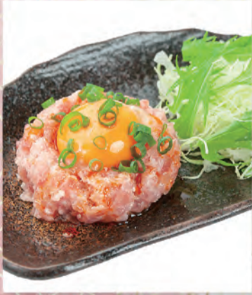
ネギトロユッケ風 455円 161kcal/塩分0.4g (税込500円)