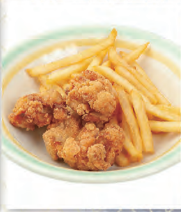
唐揚げポテト 500円 548kcal/塩分2.7g (税込550円)