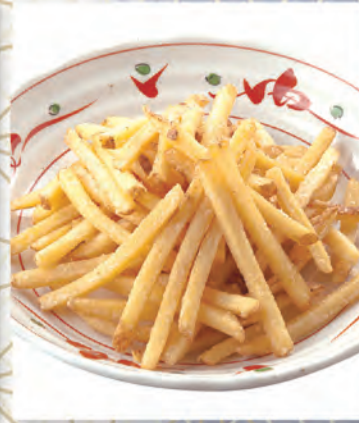
大盛ポテトフライ 410円 567kcal/塩分2.8g (税込450円)