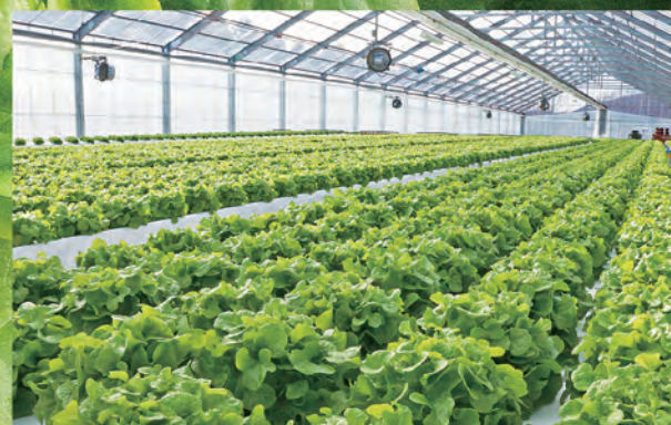
亘理ファーム ハウス内でのソフトレタス栽培