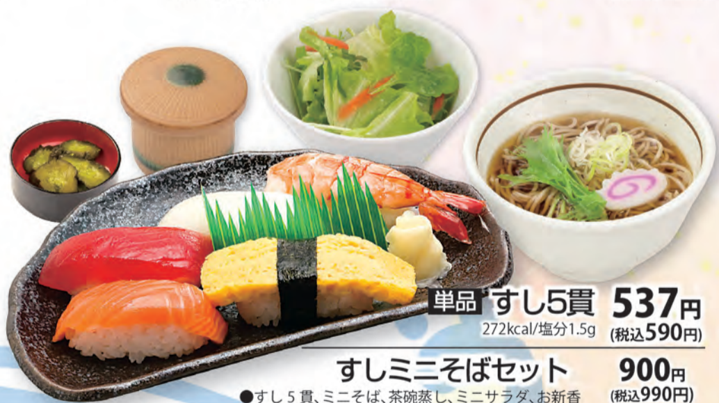
単品 すし5貫 272kcal/塩分1.5g 537円 (税込590円)