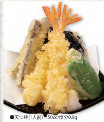
天ぷら盛合せ 546円 258kcal/塩分0.5g (税込600円)