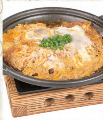
かつとじ 682円 635kcal/塩分4.7g (税込750円)