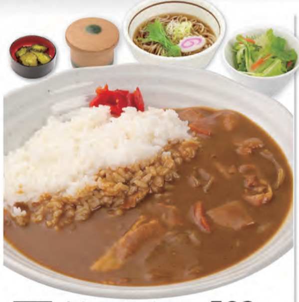
単品 カレーライス 642kcal/塩分4.1g 582円 (税込640円)