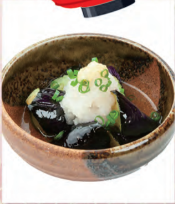
揚げなすおろしポン酢 273円 123kcal/塩分0.9g (税込300円)