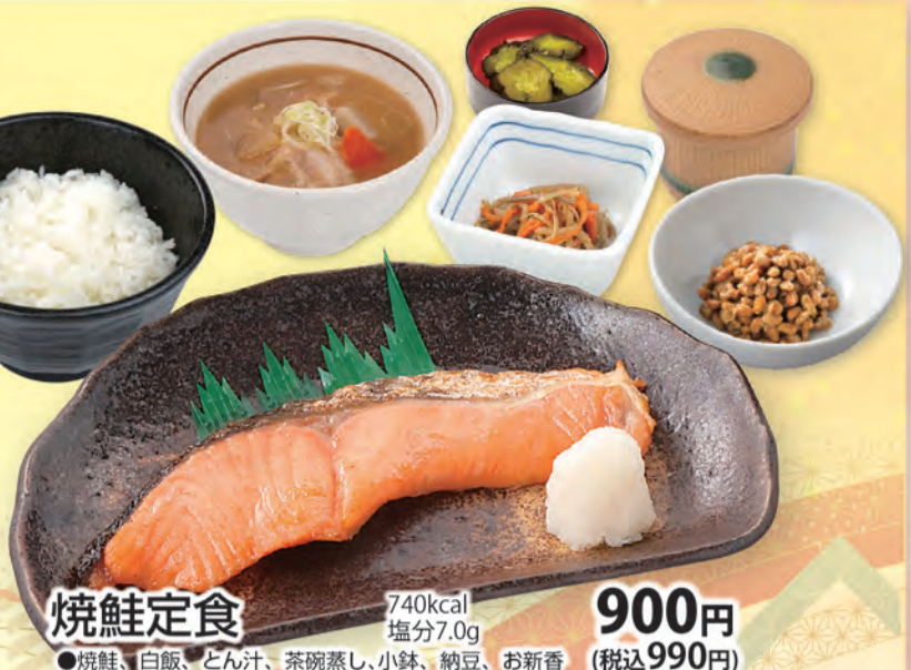
焼鮭定食 740kcal 塩分7.0g 900円 (税込990円) ●焼鮭、白飯、とん汁、茶碗蒸し、小鉢、納豆、お新香