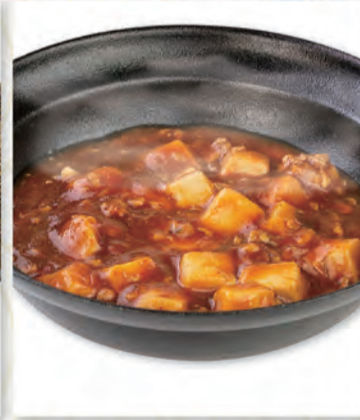
マーボー豆腐 446円 267kcal/塩分3.7g (税込490円)