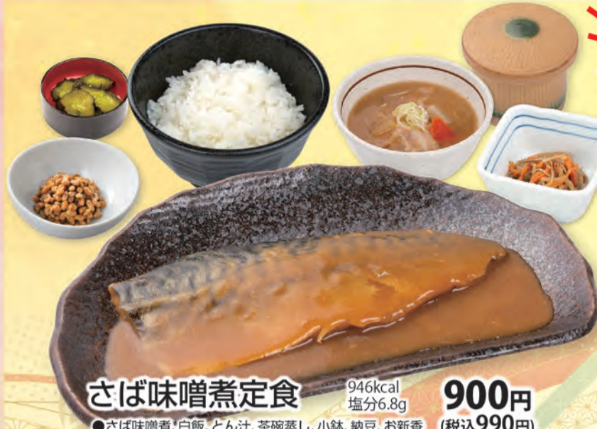
さば味噌煮定食 946kcal 塩分6.8g 900円 (税込990円) ●さば味噌煮、白飯、とん汁、茶碗蒸し、小鉢、納豆、お新香