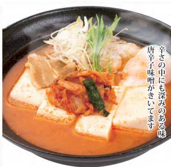
豆腐チゲ 582円 390kcal/塩分7.6g (税込640円)