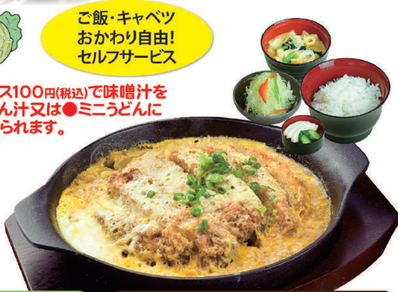
かつ鍋ランチ 800円(税込880円) ★かつ鍋にはミニサラダがつきます