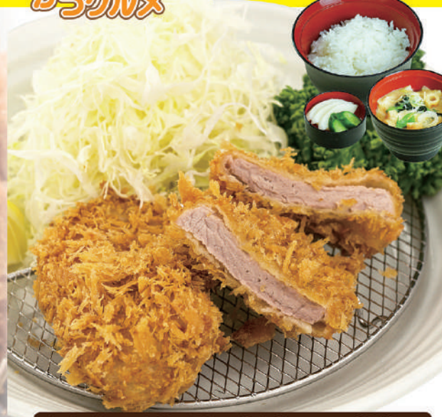
ヒレかつランチ 800円(税込880円)