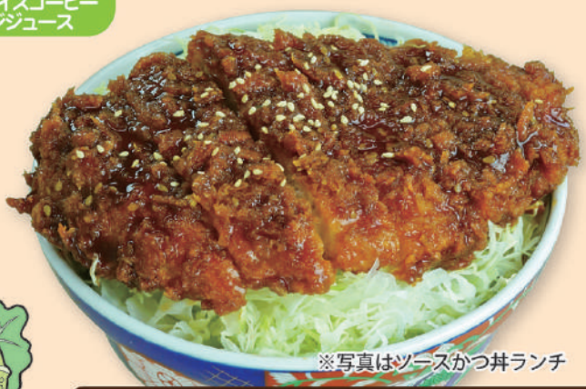
※写真はソースかつ丼ランチ