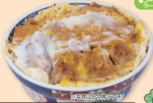
※写真はかつ丼ランチ