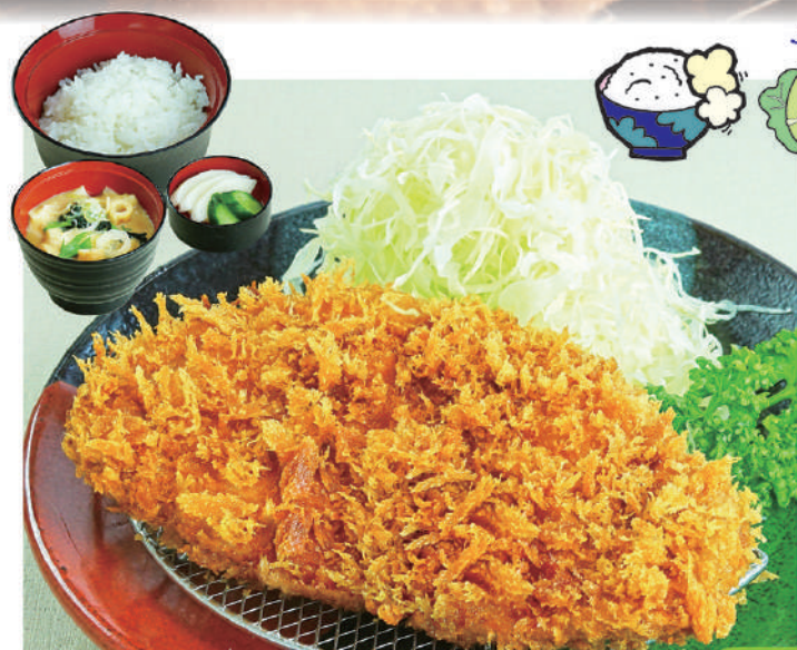
ローズかつランチ 800円(税込880円)