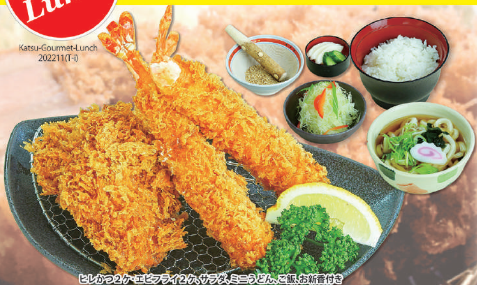
ヒレかつ2ヶ・エビフライ2ヶ、サラダ、ミニうどん、ご飯、お新香付き エビ・ヒレ満足ランチ 1,091円(税込1,200円)